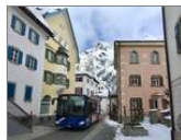
Engadin Bus, St.Moritz. Mercedes-Benz Citaro C2 (GR 100'112) in Sils Maria. (1.4.2018) Luca Devecchi

Schweiz / Regionen / Kt. Graubünden , Schweiz / Betriebe / SBC Chur (Stadtbus, Engadinbus) , Bustypen / Stadtbusse / Mercedes-Benz O 530 III (Citaro 2. Generation) 👁 94 1200x900 Px, 01.04.2018