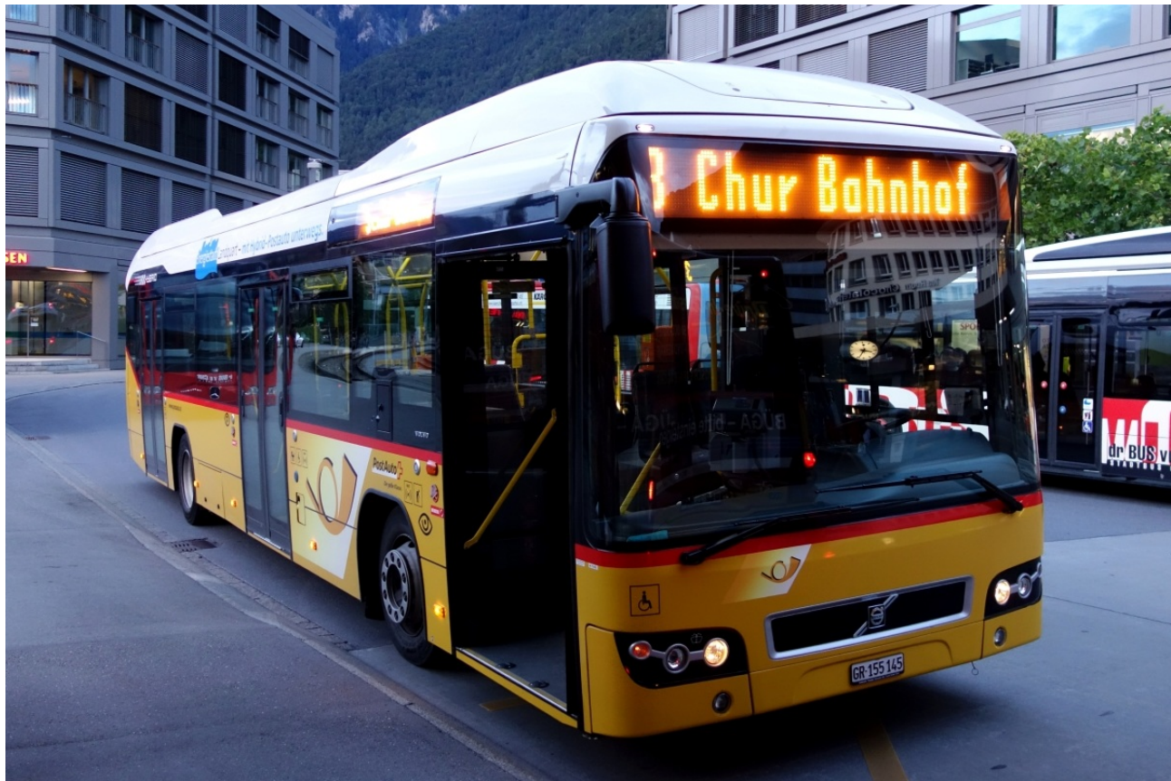
Postauto PU Dünser Trimmis, Volvo 7770 Hybrid (GR 155145, ex. PU Luk Grüşch, 2011) am 16. August 2014 in Chur Bahnhofplatz.

bündner 15.09.2014, 334 Aufrufe, 0 Kommentare